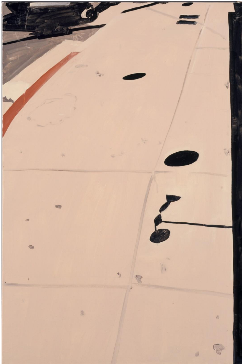
Melrose Ave balloons (2007), Oil on canvas, 166 x 100 cm, courtesy S.M.A.K. Gent

KOEN VAN DEN BROEK: Afwezigheid is belangrijker dan aanwezigheid