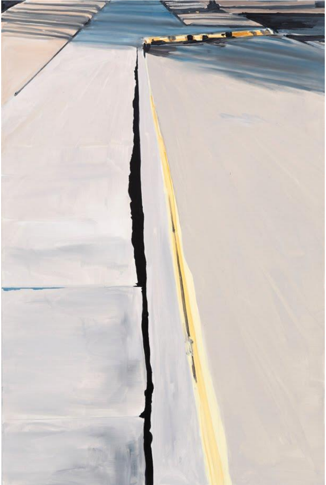
Fort Worth Yellow (2008)