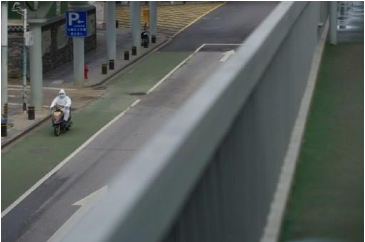
Een man in beschermende kledij in de straten van Wuhan.

Het zijn evenwel geen normale tijden, dus geloof ik niet zozeer door het beeld zelf maar vooral door de bekende context dat we hier 'de lege straten' van de eerste besmette stad zien.